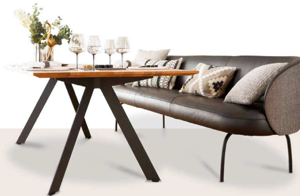
Bezug: Rücken und Seitenteile außen V39/97 black and white; Rücken und Seitenteile innen, Sitzfläche Z73/99 nachtschwarz