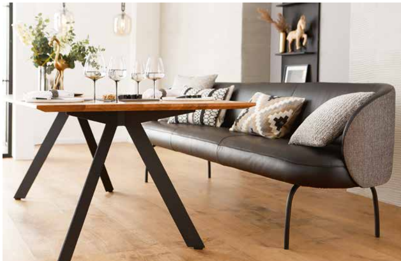
Bezug: Rücken und Seitenteile außen V39/97 black and white; Rücken und Seitenteile innen, Sitzfläche Z73/99