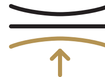
Körperunterstützung durch RE:FLEX und Taschenfederkern

Weniger Druck – mehr Tiefschlafpotenzial