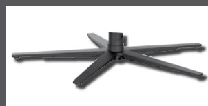
Metall-Sternfuß verchromt Edelstahl optik oder pulverbeschichtet anthrazit