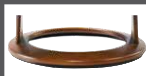
Holzdrehring in mehreren Farben