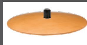
Holzteller in mehreren Farben