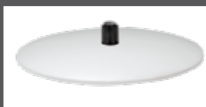
Bezogener Teller (Leder oder Stoff)