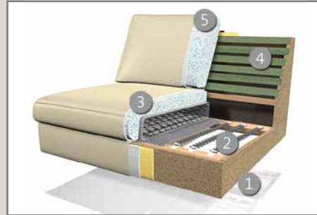
Das Design des hier abgebildeten Querschnitts entspricht nicht dem Modell dieses Katalogblattes.