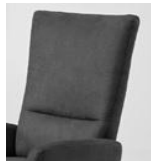
Typ A glatt