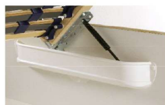
Luxus-Gasdruckfeder zum Öffnen des Lattenrahmens und Nutzung des Stauraums