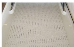
Bodenplatte gelocht für optimale Luftzirkulation