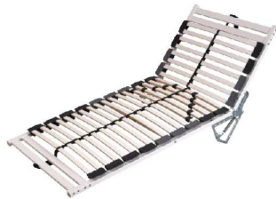
LR 26 XL