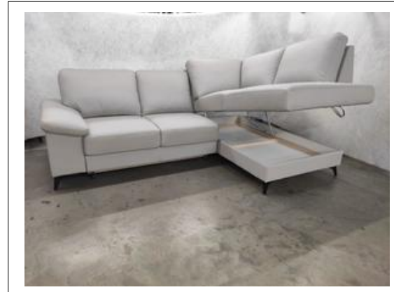
Toby II 2F-OTMBK