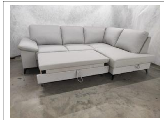
Toby II 2F-OTMBK