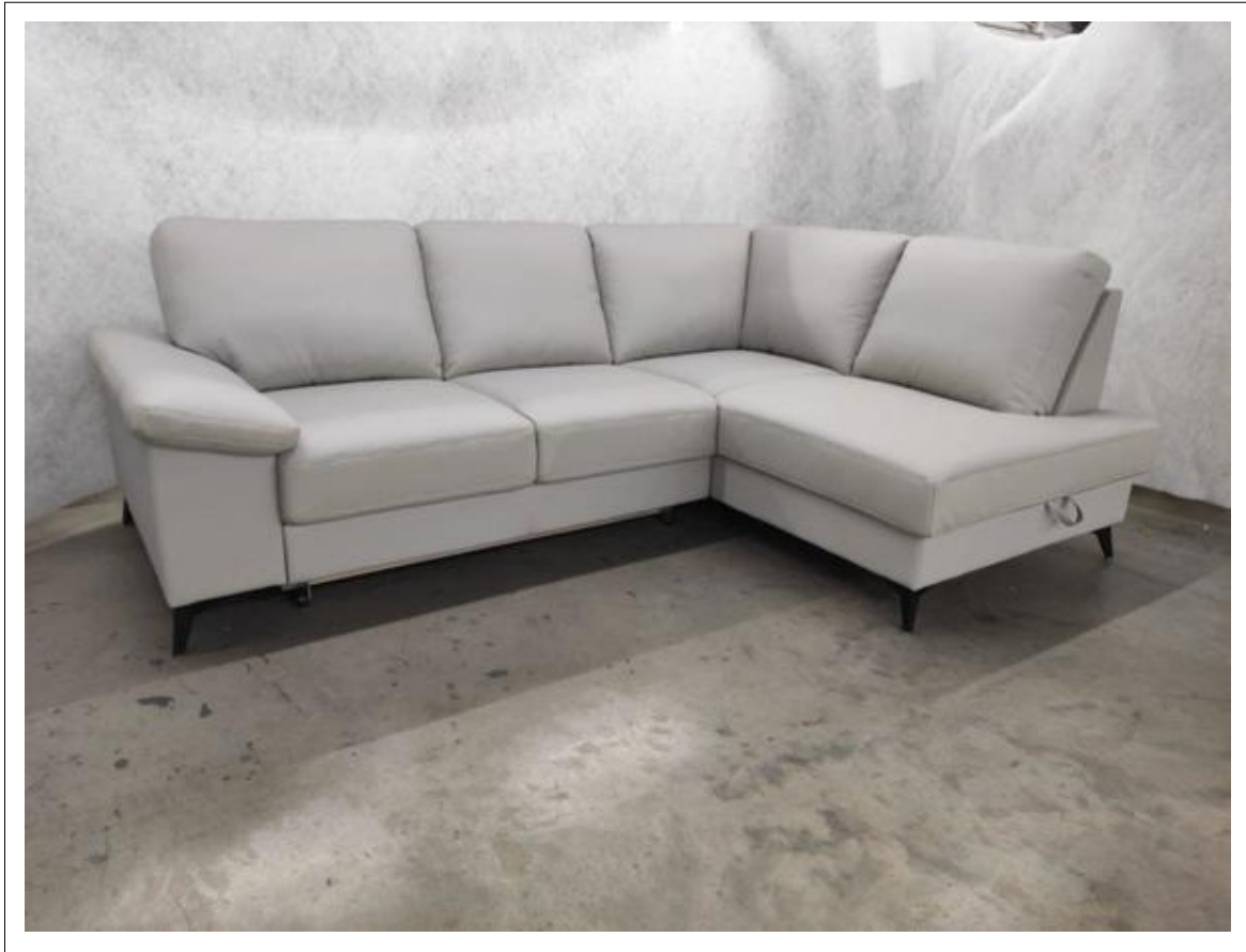
Toby II 2F-OTMBK