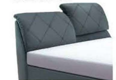
0853KV Höhe 112-123 cm nur lieferbar bei Bettgrößen 160-200cm Breite