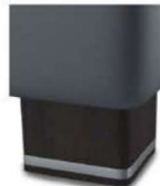
H 05-10 H 05-15 Holzfuß wengefarbig