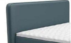
0383 Höhe 116 cm