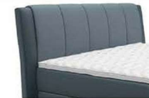
0378 Höhe 116 cm