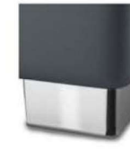
M 09-10 M 09-15 Metallfuß verchromt