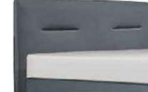
0800 Höhe 126 cm