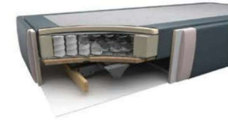
Taschenfederkern mit Motor