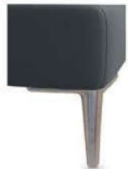
A11-10/M12 A11-15/M12 Alufuß gebürstet