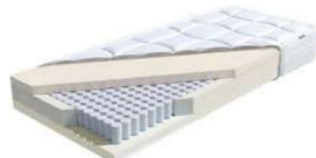
MA 350 / MS 358

Höhe: ca. 21 cm (Drellbezug) Höhe: ca. 18 cm (Stoffbezug)