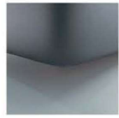
K08-10 K08-15 Schwebeoptik