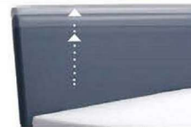
0300 Multimaß Höhe 55 - 125 cm in 5cm-Schritten kürzbar