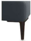
A11-10/M01 A11-15/M01 Alufuß schwarz matt