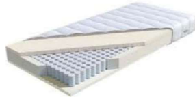
MA 222 / MS 228