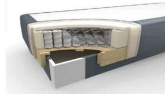
Taschenfederkern mit Bettkasten