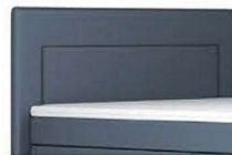
0025 Höhe 109 cm