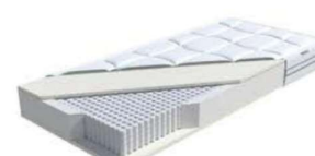
MA 420 / MS 428

Höhe: ca. 26 cm (Drellbezug) Höhe: ca. 23 cm (Stoffbezug)