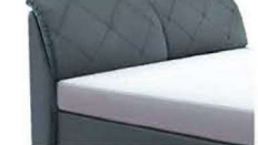
0853 Höhe 112 cm