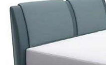
0817 Höhe 116 cm