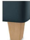
H17-10 H17-15 Holzfuß Buche natur lackiert