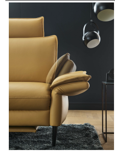
Liegearmlehne in allen Elementen mit Armlehne möglich ( außer beim Sessel )