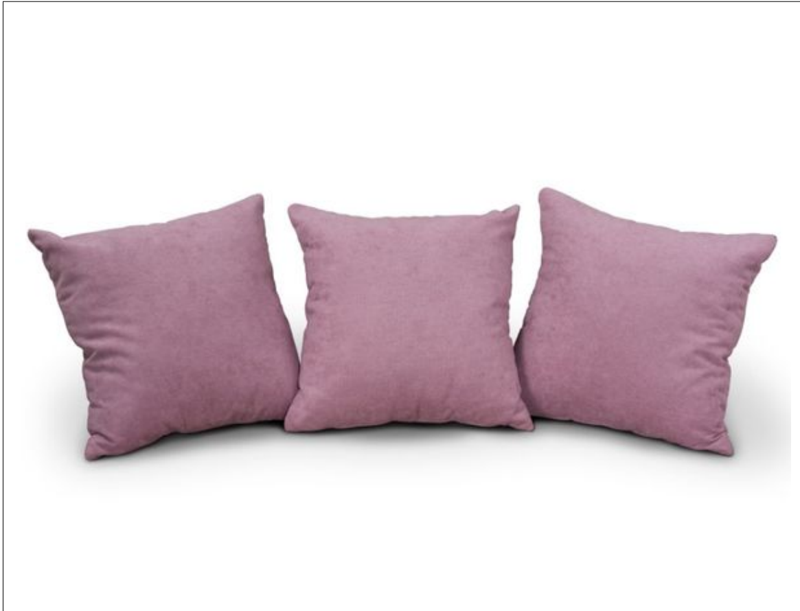
KISSENSATZ MIT 3STK M225125 F195(2)